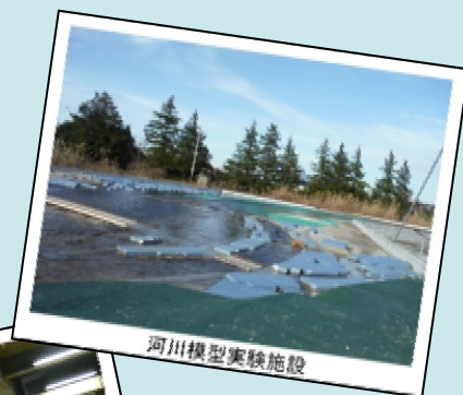
河川模型実験施設