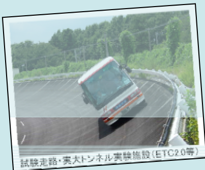
試験道路・実大トンネル実験施設(ETC2.0等)

道路・河川・砂防・耐震など、あなたの生活を守り作る 土木の研究を見てみませんか?