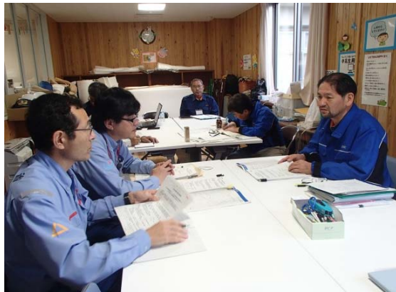
益城町長への緊急点検結果の報告