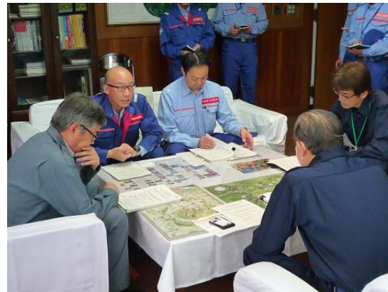
南阿蘇村長への緊急点検結果の報告