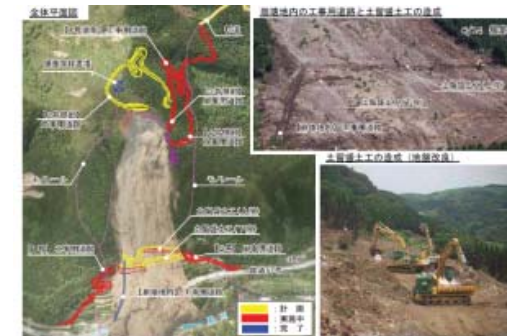
工事全体計画検討