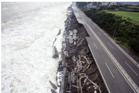
写真 平成19年西湘バイパスの被災

インフラの維持管理では予防保全が推進されており、砂浜の保全には、モニタリング重要である。侵食が進行する海岸を早期に発見し、被害が生じる前に対策を行う為に、全国の砂浜モニタリングを高頻度で実施する手法の開発が求められる。