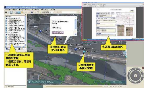
図2 河川巡視日誌の整理への活用

那賀川(那賀川河川事務所)では、河川巡視日誌の整理にCommonMP-GISを活用している(図2)。巡視日誌毎に点検箇所を登録することで、点検日毎、点検箇所毎の巡視日誌の検索が容易になり、河川管理の効率化が図られている。