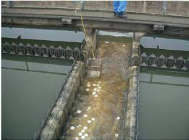
固形塩素による初期段階の消毒の状況

災害時に確保すべき下水道機能については、東日本大震災を受けて設置された「下水道地震・津波対策技術検討委