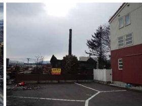
写真2 軽微な被害の建物

たことが、その要因として推定されます(写真2)。また、住民への聞き取り調査や火災現場の焼損状況等からは、飛び火による延焼の可能性が考えられる範囲も多数見受けられました。