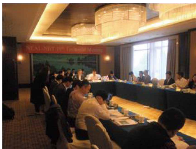
写真 NEAL-NET 専門家会合の様子(2016年11月)

今後も、ユーザーにとってより有益なものとなるように、NEAL-NET 開発の技術支援を行う予定です。