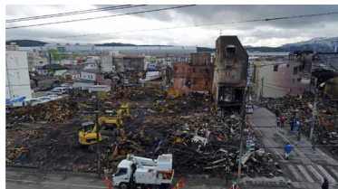
写真1 焼損区域中央部の被害

一方、焼損区域内では、網入りガラスの亀裂等、軽微な被害にとどまった建物も見受けられました。建物の防火性能が比較的高いことに加え、建物周辺に空地があり隣棟間隔が大きかった