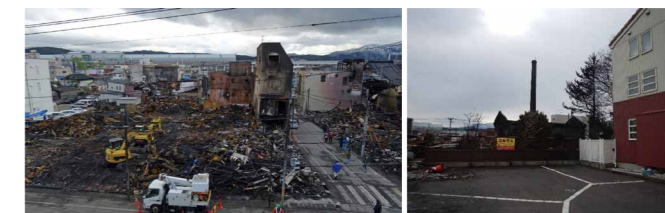
写真1 焼損区域中央部の被害 写真2 軽微な被害の建物

一方、焼損区域内では、網入りガラスの亀裂等、軽微な被害にとどまった建物も見受けられました。建物の防火性能が比較的高いことに加え、建物周辺に空地があり隣棟間隔が大きかった