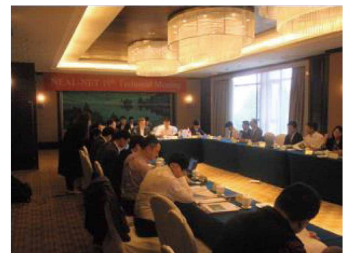
写真 NEAL-NET 専門家会合の様子(2016年11月)

今後も、ユーザーにとってより有益なものとなるように、NEAL-NET 開発の技術支援を行う予定です。