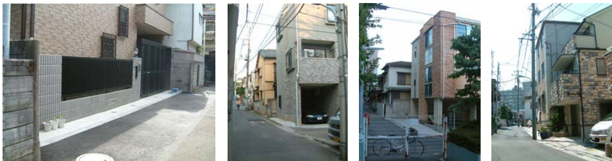
写真 5-1 街並み誘導型地区計画の認定を受けて建替った建物