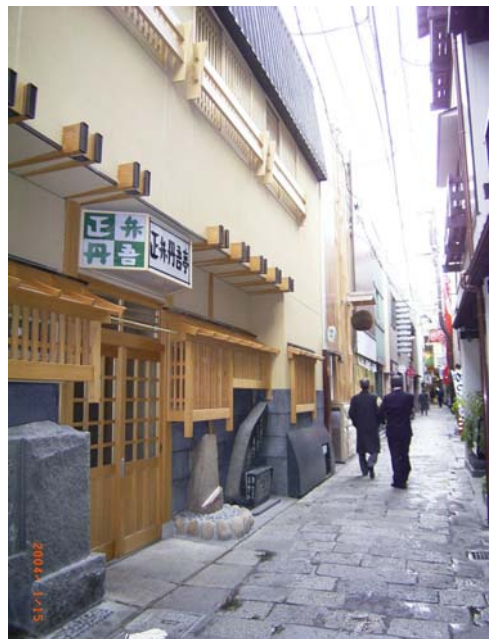
写真 5-2 現在の法善寺横丁の様子