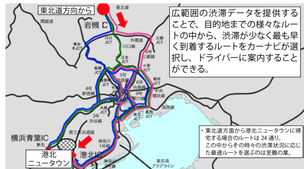
ダイナミックルートガイダンス