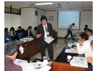
発表風景（左：関谷主任研究官、右：土肥主任研究官）