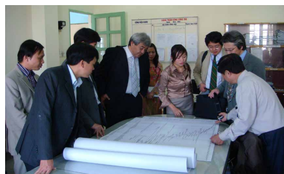
施設視察（ITST ダナン支部）