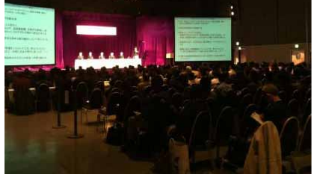
シンポジウム当日の様子

うした取り組みをきっかけに、さらに各事業者において、遊戯施設の運行の安全を高める取り組みが進められることを期待します。