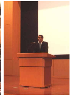
開会挨拶(西川所長)