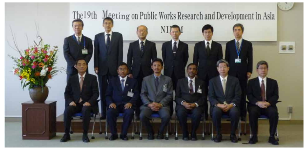
第 19 回アジア会議集合写真

なお、昨年 6 月に政府において「新成長戦略」が決定され、我が国の成長分野の 1 つとして、「アジア経済戦略」が明確に打ち出されました。こうした状況を背景に、国総研ではこれまでの広くアジア全域を対象とする活動から、2 カ国間の研究連携にその活動の重点を移すこととし、より効果的に活動を行なうため本年度にて本会議はひとまず閉幕することとしました。