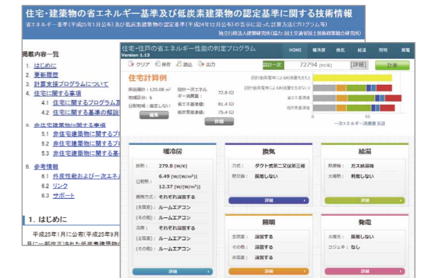
図 ホームページ(左奥)とWebプログラム(右手前)の例

詳細 ● 住宅・建築物の省エネルギー基準及び低炭素建築物の認定基準に関する技術情報 ((独)建築研究所 HP) http://www.kenken.go.jp/becc/index.html