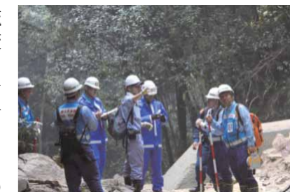
写真 現場での災害状況把握

詳細 ● 砂防研究室 HP「災害情報」 http://www.nilim.go.jp/lab/rbg/