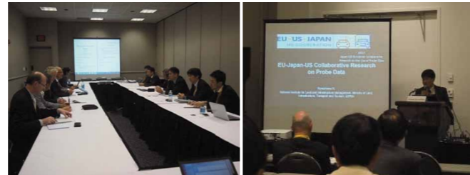
写真 個別会議・特別セッションでの発表の様子

今後、本会議で得られた情報も参考として、道路利用者のために、路車間サービスの実用化で先行する日本のITSを、さらに高度化・普及させるための調査研究開発を進めていきます。